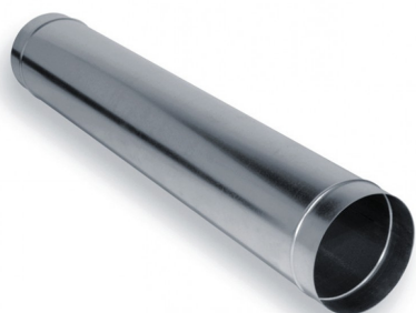
Condotta circolare calandrata